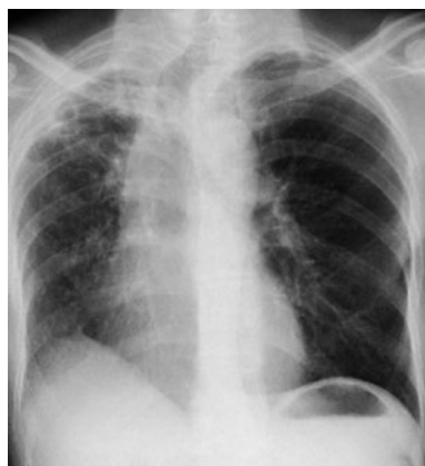
Fig. 1 Chest X-ray film showed cavitory lesions in the right upper lung field.