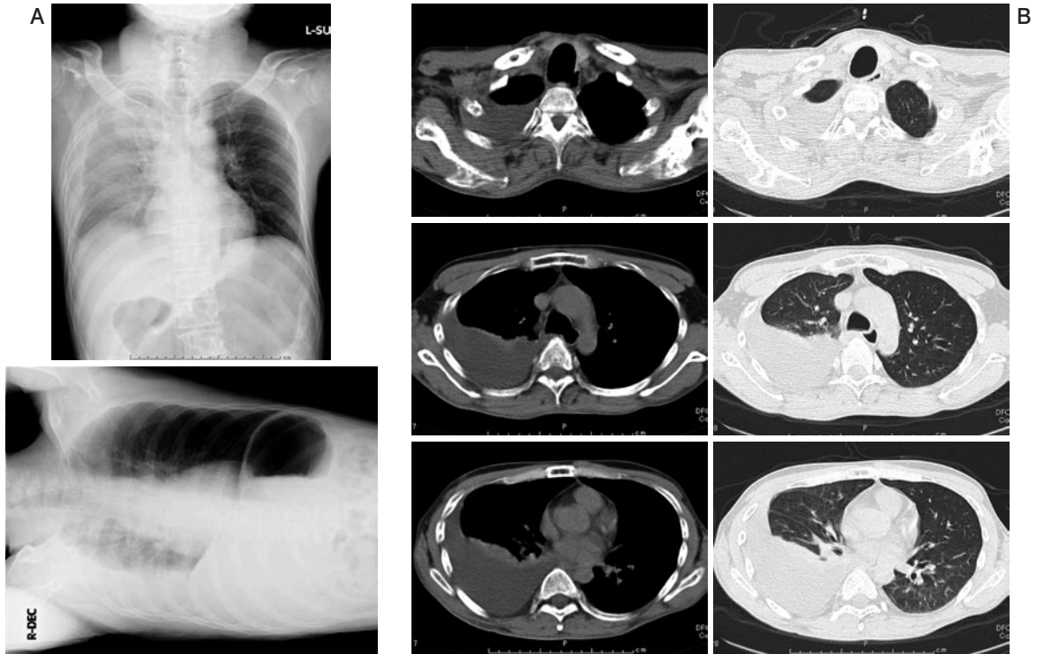
図1 (A)入院時に撮影した胸部X線写真臥位正面像。右肺野の透過性が低下しており、右側臥位像で鏡面像を認めた。(B)入院時に撮影した胸部CT。肺炎像や腫瘤影は認めず、右胸水と随伴する無気肺を認めた。また、リンパ節の腫大は認めなかった。